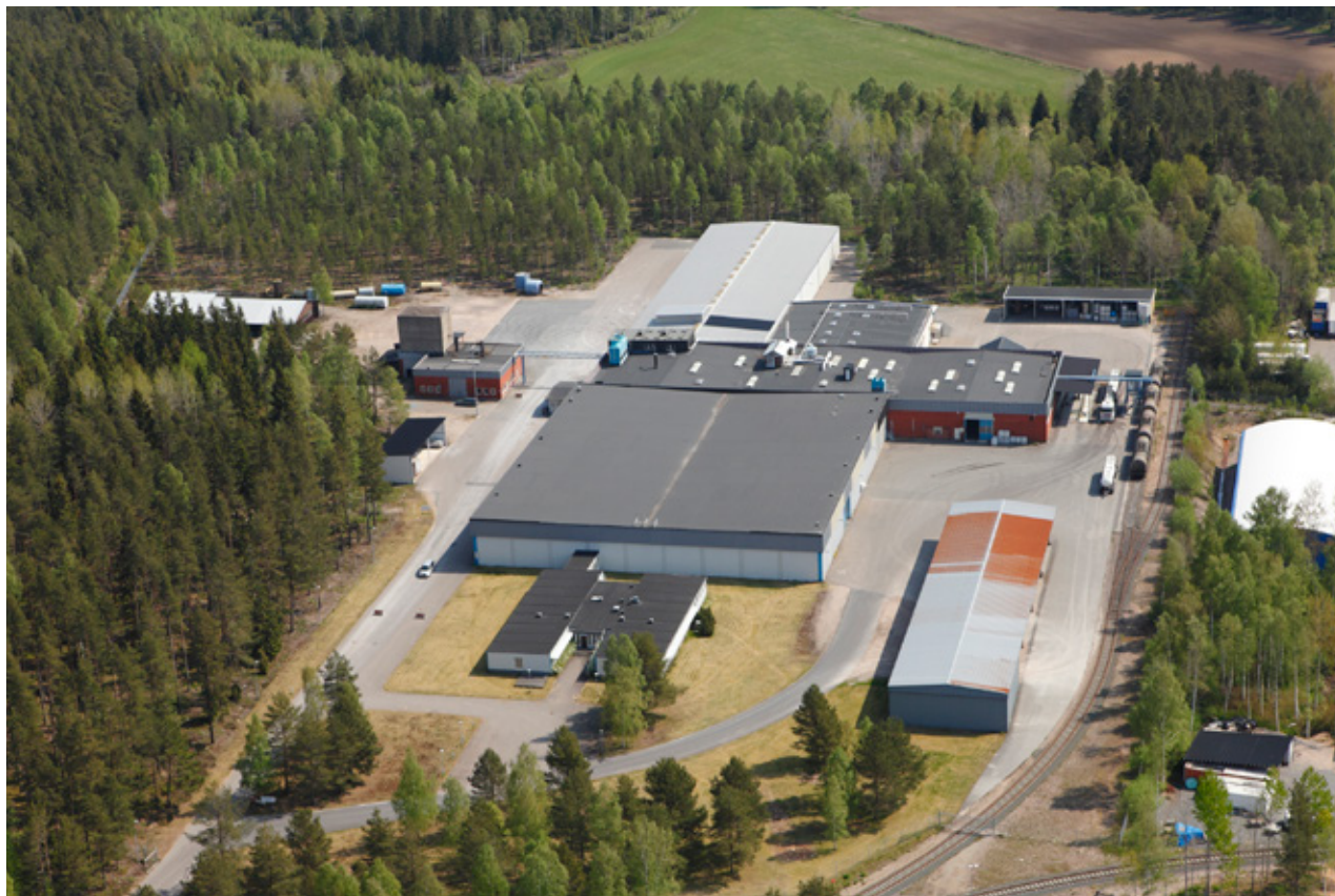
Feralco Nordics anläggning i Vetlanda.