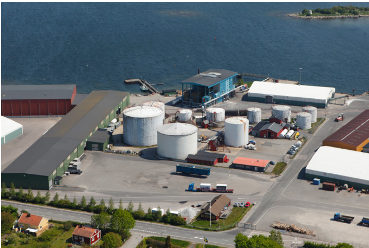
Feralco Nordics anläggning i Sölvesborg.